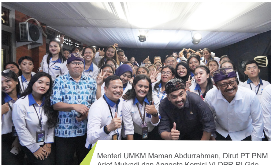
Menteri UMKM Maman Abdurrahman, Dirut PT PNM Arief Mulyadi dan Anggota Komisi VI DPR RI Gde Sumarjaya Linggih berfoto bersama pegawai PNM Cabang Denpasar.

Dengan menjaga kualitas usaha nasabah, PNM percaya bahwa upaya ini akan meningkatkan potensi pembukaan lapangan pekerjaan serta membantu masyarakat prasejahtera untuk mendapatkan penghasilan. ●