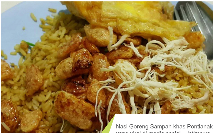
Nasi Goreng Sampah khas Pontianak yang viral di media sosial.

Di balik setiap piring nasi goreng yang terhidang, ada cerita perjuangan dan cinta seorang ibu untuk masa depan yang lebih baik. ●