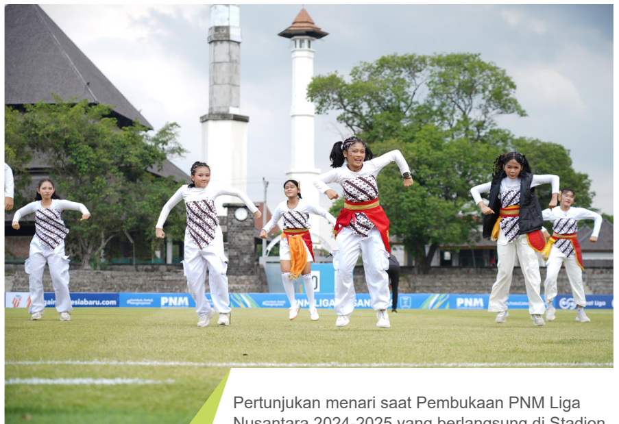
Pertunjukan menari saat Pembukaan PNM Liga Nusantara 2024-2025 yang berlangsung di Stadion Sriwedari, Solo.

PNM Liga Nusantara 2024/2025 ini diyakini akan melahirkan talenta baru sepak bola untuk Indonesia. Menurut Erick, hal ini sejalan dengan visi PSSI yang ingin membangun