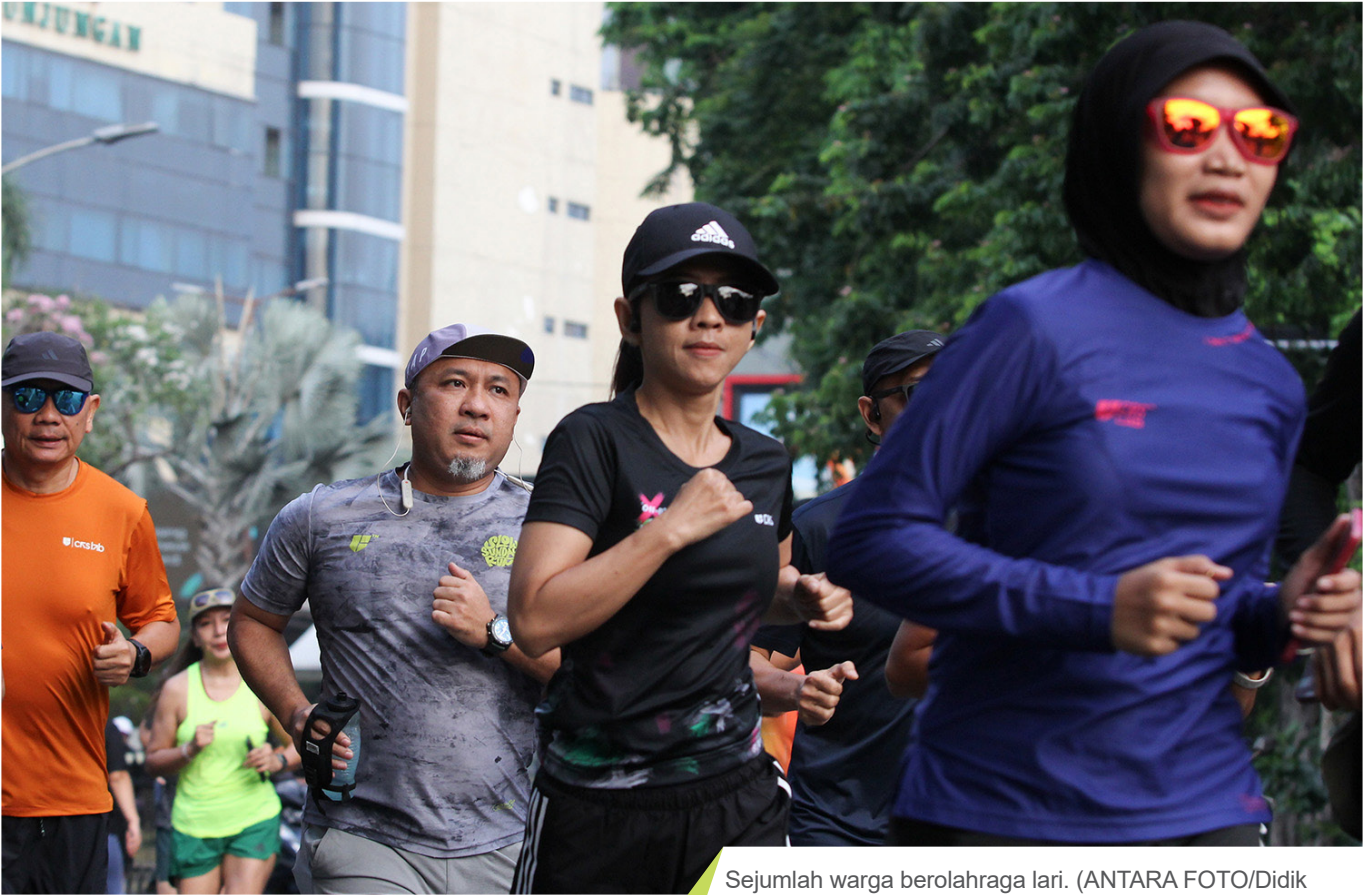
Sejumlah warga berolahraga lari.

mengurangi ketegangan dalam hitungan menit.