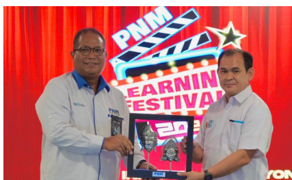
PNM Learning Festival 2024 "Goes to Infinity and Beyond", (7 Oktober 2024).