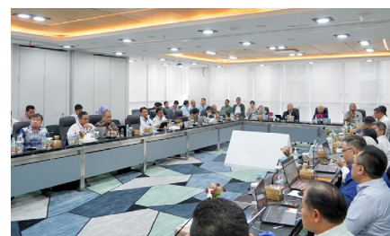
Pembahasan Dashboard Kementerian Koordinator Bidang Pangan dengan PT PNM, (13 November 2024).