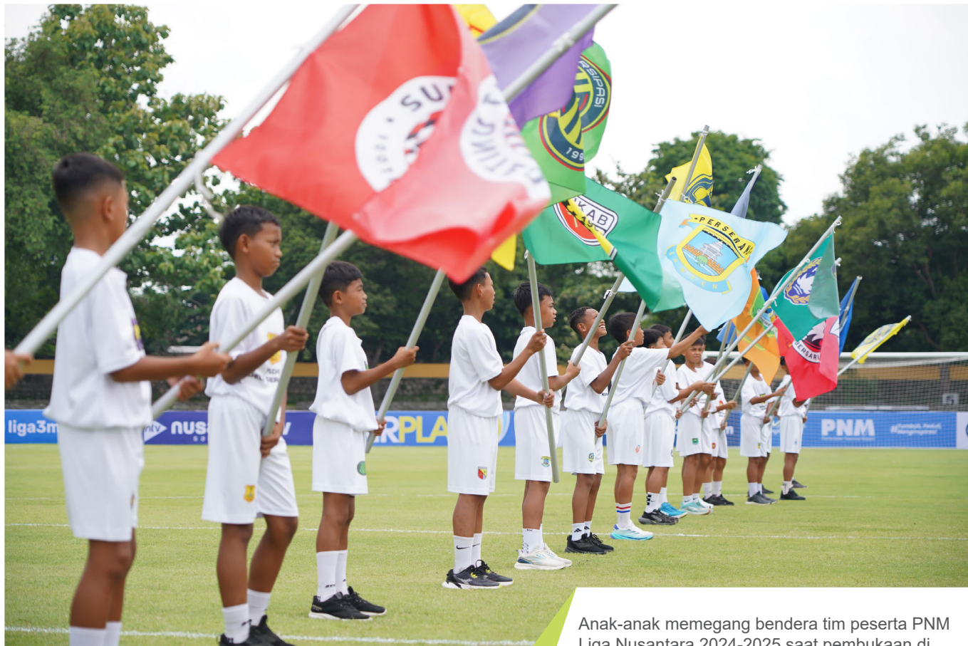
Anak-anak memegang bendera tim peserta PNM Liga Nusantara 2024-2025 saat pembukaan di Stadion Sriwedari, Solo.