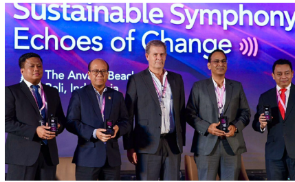
International Conference Risk Beyond 2024 Sustainability Symphony: Echoes of Change , (5 Desember 2024).