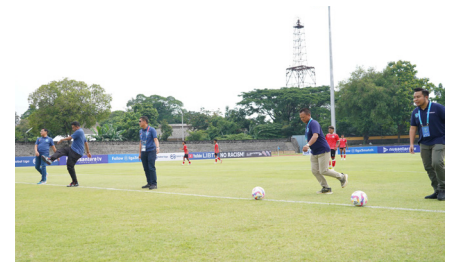
Kick Off PNM Liga Nusantara , (13 Desember 2024).