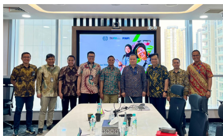
Pertemuan International Labour Organization (ILO) dengan PT PNM, (3 September 2024).