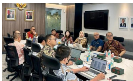
Undangan Pembahasan Fungsi Kepatuhan Terintegrasi pada LJK Anggota Konglomerasi Keuangan BRI Triwulan II Tahun 2024, (3 September 2024).