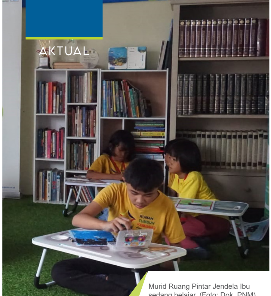
Murid Ruang Pintar Jendela Ibu sedang belajar.

Ruang Pintar menyediakan kelas untuk 25-35 anak dengan