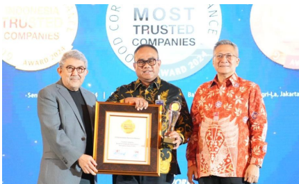
CGPI Awards 2024: Enhancing Corporate Maturity & Credibility in the Corridor GCG , PNM Mendapatkan Award: Indonesia Trusted Companies , (25 November 2024).