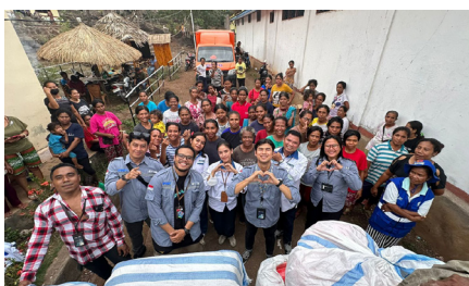
Penyerahan Bantuan Kepada Masyarakat Terdampak Erupsi Gunung Lewotobi, (6 November 2024).