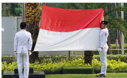
Upacara Pengibaran Bendera Merah Putih Memperingati Hari Pahlawan, (10 November 2024).