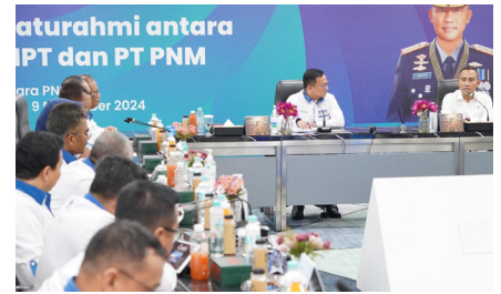
Silahturahi antara BNPT dan PT PNM, (9 Desember 2024).