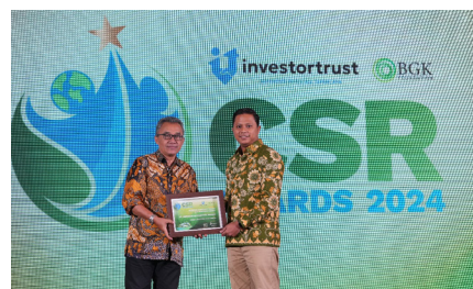
PNM Mendapatkan penghargaan "Special Awards : Elevating Community Health and Sanitation Award" pada Investor Trust CSR Awards 2024, (24 Oktober 2024).