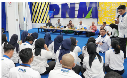
Awak Datang Kamek Sambot: Kunjungan Menteri UMKM ke PNM Cabang Pontianak, (11 November 2024).