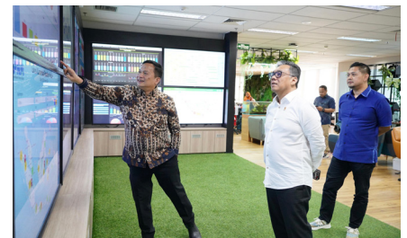
Pertemuan Direktur Utama dengan Utusan Khusus Presiden, (10 Desember 2024).