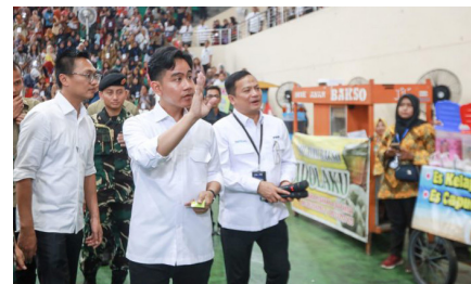
Silaturahmi Wapres RI dengan Peserta dan Pendamping Program Mekaar Binaan Permodalan Nasional Madani (PNM), (22 November 2024).