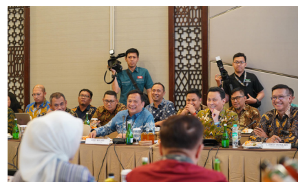
Kunjungan Kerja Spesifik Komisi VI DPR RI Masa Persidangan I Tahun Sidang 2024-2025 ke Kota Mataram NTB, (24 September 2024).