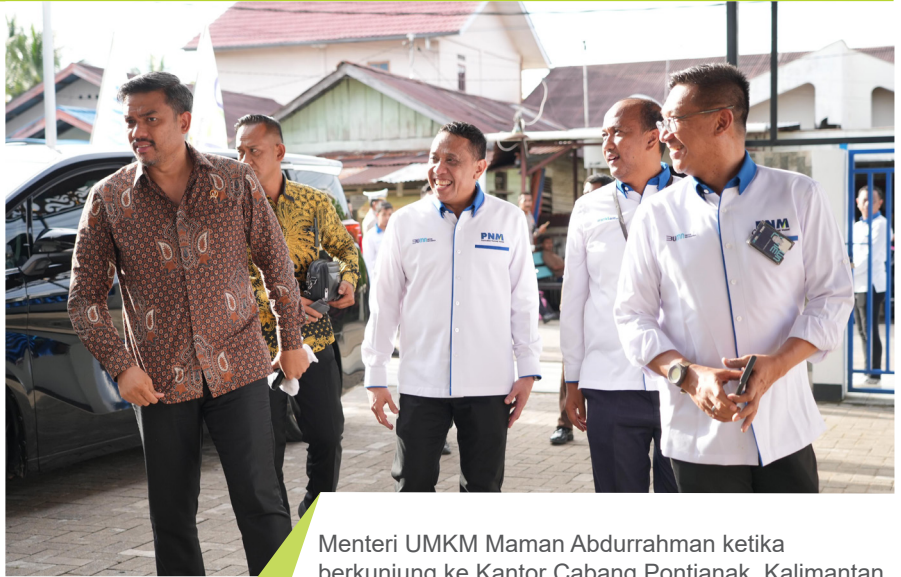
Menteri UMKM Maman Abdurrahman ketika berkunjung ke Kantor Cabang Pontianak, Kalimantan Barat.

Kontribusi PNM terhadap perekonomian rakyat ini dinilai Maman sangat dirasakan manfaatnya, terlebih bagi masyarakat golongan prasejahtera. PNM tak hanya sekadar aset yang dimiliki negara, tetapi juga turut membantu menyukseskan program Presiden Prabowo dan Wapres Gibran untuk