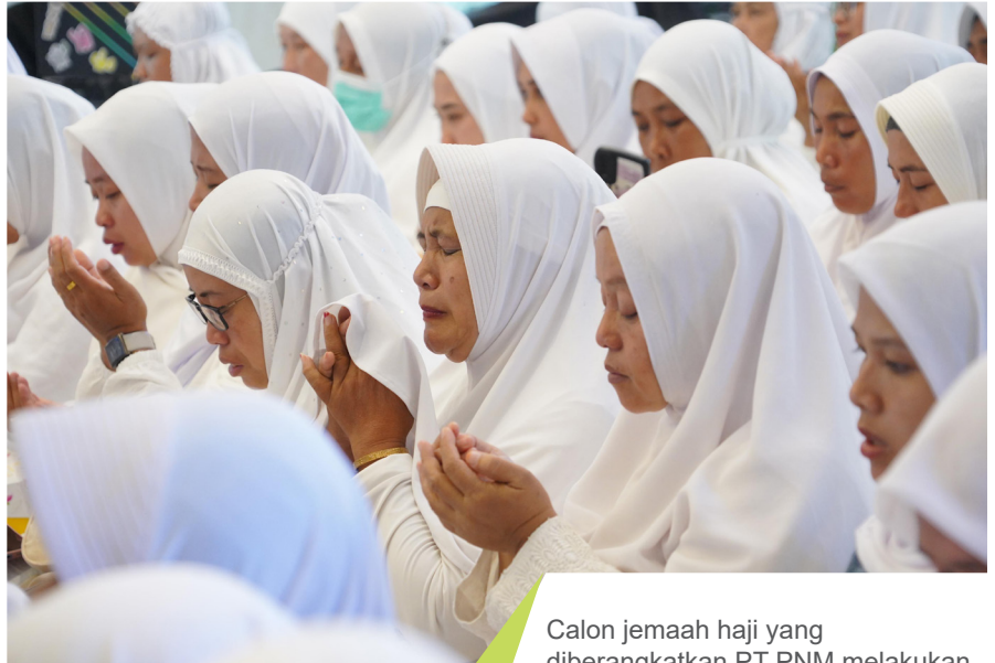
Calon jemaah haji yang diberangkatkan PT PNM melakukan doa bersama.

Direktur Utama PNM, Arief Mulyadi, dalam pidatonya di acara pelepasan ini menegaskan bahwa program ini adalah bentuk