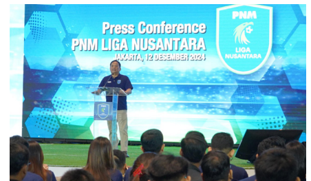
Press Conference & Launching PNM Liga Nusantara 2024-2025 , (12 Desember 2024).