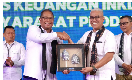
PKU Akbar PNM Cabang Padang Dengan Tema: Akses Keuangan Inklusif Masyarakat Produktif, (26 Oktober 2024).