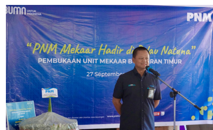
Peresmian Pembukaan Unit Baru 3T Mekaar Bunguran Timur, PNM Cabang Pekanbaru, (27 September 2024).