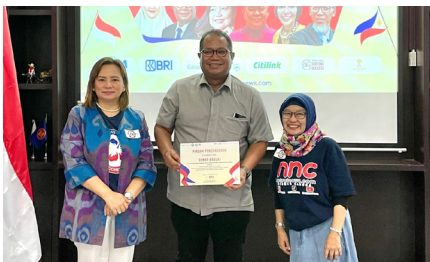
Webinar & Bazar UMKM "Kepoin Produk Paling Dicari Filipina Potensi Ekspor UMKM", (30 November 2024).