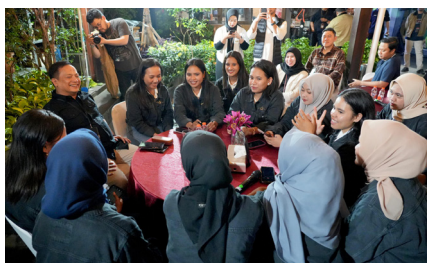
Meet the CEO dengan AO Duta PKM, (11 Oktober 2024).