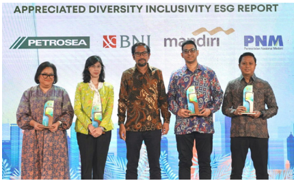
Investor Daily ESG Appreciation Night 2024 dengan kategori Appreciated Diversity Inclusivity ESG Report , (25 November 2024).