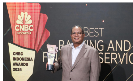
CNBC Indonesia Awards 2024: Best Financial Services dengan kategori Best Ultra Micro Finance for Empowering Women in Business , (30 Oktober 2024).