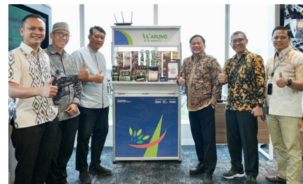
Pertemuan Direktur Utama dengan Founder Gerakan Desa Emas, (12 November 2024).