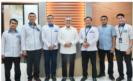
Pertemuan Direktur Utama dengan Menteri Koordinator Bidang Pangan RI, (4 November 2024).