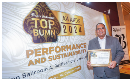
Meraih Penghargaan Bisnis Indonesia TOP BUMN Awards 2024 pada Kategori Perusahaan Non Terbuka – Sektor Keuangan dan The Best Stated - Owned Enterprise 2024 , (2 Oktober 2024).