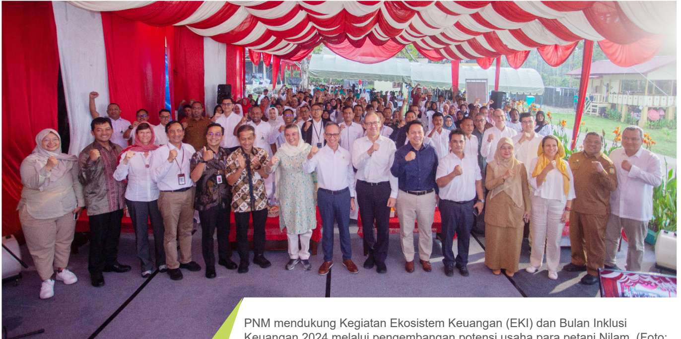
PNM mendukung Kegiatan Ekosistem Keuangan (EKI) dan Bulan Inklusi Keuangan 2024 melalui pengembangan potensi usaha para petani Nilam.