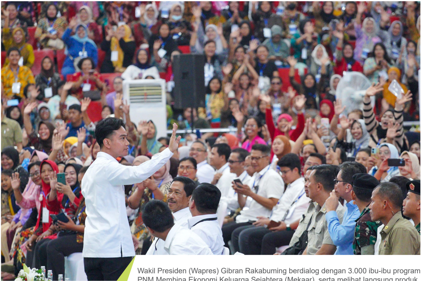
Wakil Presiden (Wapres) Gibran Rakabuming berdialog dengan 3.000 ibu-ibu program PNM Membina Ekonomi Keluarga Sejahtera (Mekaar), serta melihat langsung produk unggulan nasabah binaan PNM.

P ERTUMBUHAN ekonomi yang berpihak kepada seluruh rakyat tanpa terkecuali, menjadi narasi besar yang digaungkan oleh Presiden Prabowo Subianto demi kesejahteraan yang merata. PT Permodalan Nasional Madani (PNM) sebagai BUMN