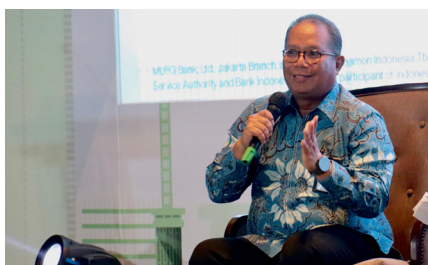
MUFG NOW - Strengthening Momentum Indonesia's Transition to Net Zero, (4 September 2024).