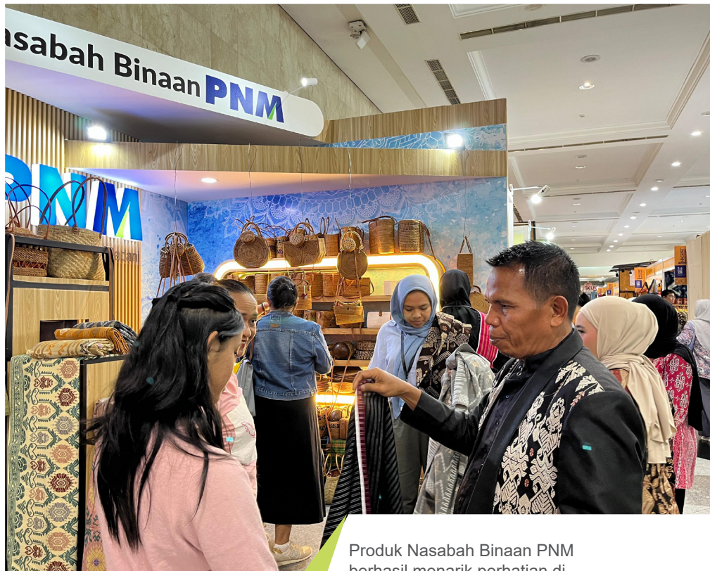
Produk Nasabah Binaan PNM berhasil menarik perhatian di pameran Inacraft 2024.

Dengan keikutsertaan ibu-ibu PNM, diharapkan dapat tercipta peluang baru bagi para nasabah untuk memperluas pasar.