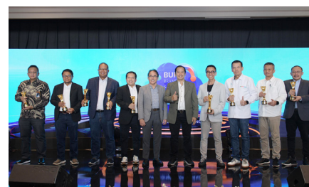
BUMN Branding & Marketing Award 2024 Tahun ke-12 dengan kategori Brand Strategy Relevance (platinum), Brand Creative Communication & Activation (platinum), dan The Best Brand Strategy Excellence (anak perusahaan BUMN), (14 November 2024).