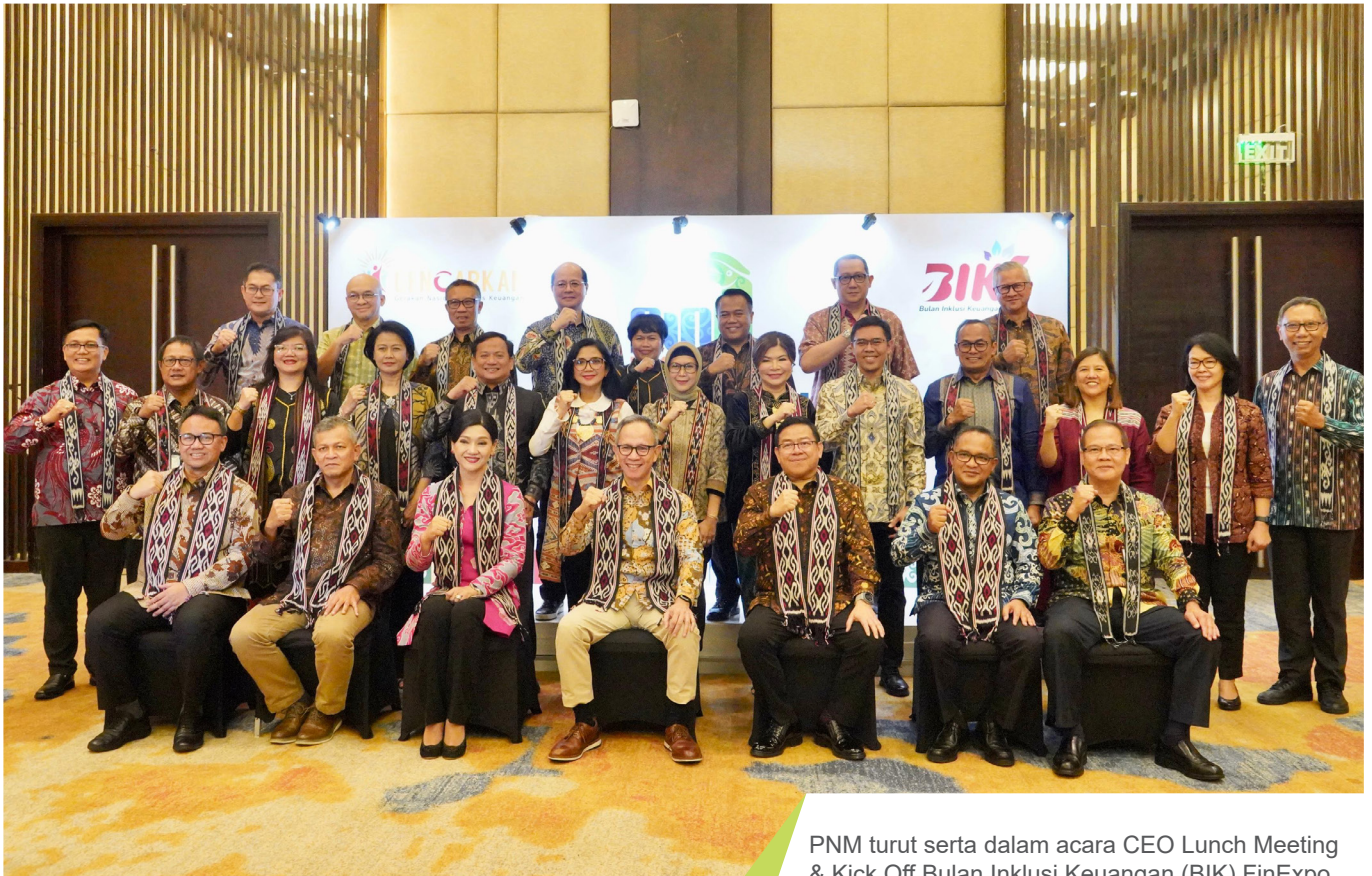
PNM turut serta dalam acara CEO Lunch Meeting & Kick Off Bulan Inklusi Keuangan (BIK) FinExpo 2024 di Kota Balikpapan, Sabtu, 5 Oktober 2024.