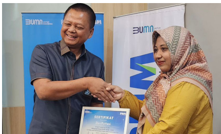
Menghadiri Kegiatan Program Inkubasi Mekaapreneur Naik Kelas 2024, (7 November 2024).