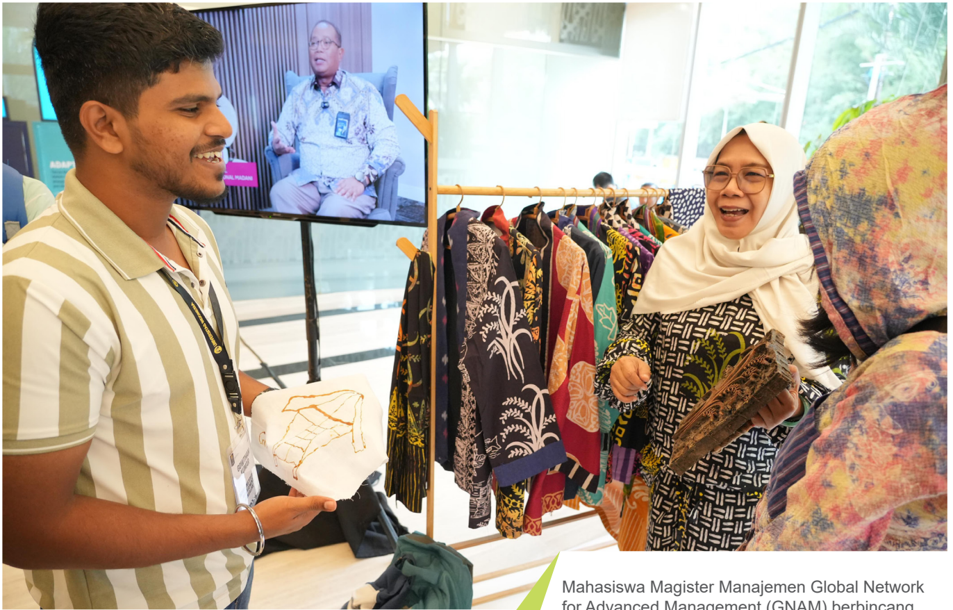
Mahasiswa Magister Manajemen Global Network for Advanced Management (GNAM) berbincang dengan Nasabah PNM.