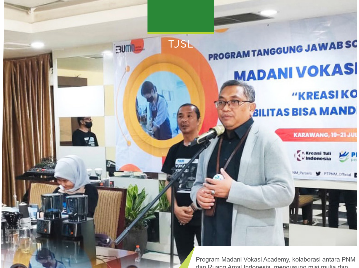
Program Madani Vokasi Academy, kolaborasi antara PNM dan Ruang Amal Indonesia, mengusung misi mulia dan memberikan harapan baru bagi mereka yang selama ini terbatas oleh kondisi ekonomi.