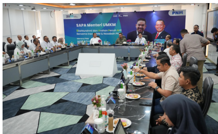
SAPA MENTERI UMKM (Silaturahmi dan Arah Penuh Arti) Bersama Insan PNM & Nasabah PNM, (8 November 2024).