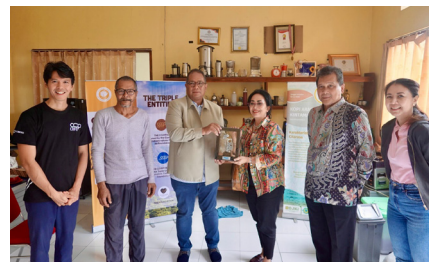
Workshop and Exposure Series 4 " Transforming Coffee Business Model: Empowering Women Coffee Growers and Waste Management ", (7 Desember 2024).