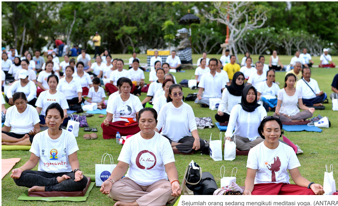
Sejumlah orang sedang mengikuti meditasi yoga.

hari dapat membantu meningkatkan energi sebelum memulai aktivitas. Sementara itu, tidur yang cukup akan memastikan tubuh dan pikiran mendapatkan waktu pemulihan optimal.