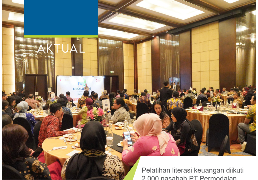
Pelatihan literasi keuangan diikuti 2.000 nasabah PT Permodalan Nasional Madani (PNM) digeber di 52 kota di Indonesia selama Bulan Inklusi Keuangan 2024.

Tantangan juga muncul karena ada kecenderungan nasabah ultramikro yang tidak memahami dengan baik produk keuangan yang digunakan sehingga tidak