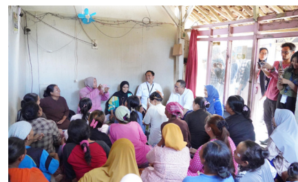
Kunjungan Staf Khusus Presiden RI Bidang Ekonomi ke Nasabah PNM Banyuwangi, (27 September 2024).