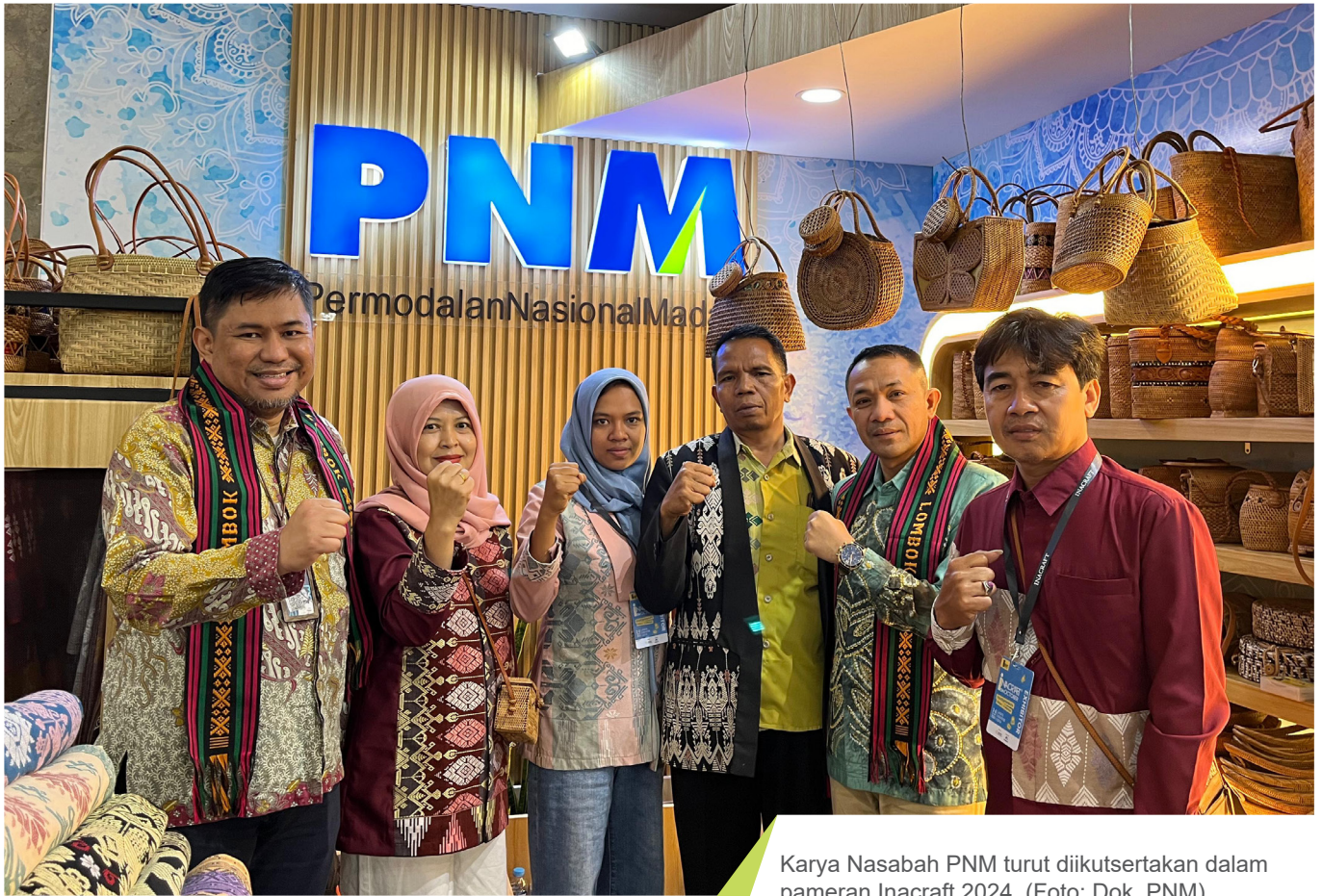
Karya Nasabah PNM turut diikutsertakan dalam pameran Inacraft 2024.