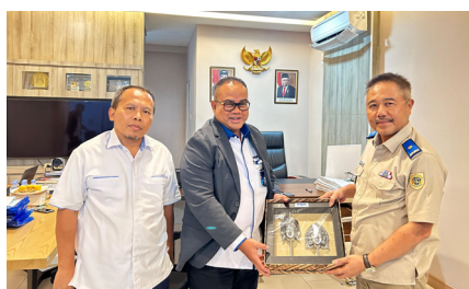
Rapat dengan Direktur PPTR ATR/BPN, (9 September 2024).