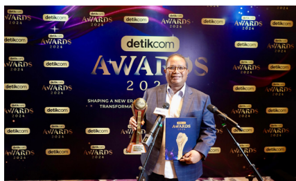
Raih Penghargaan Detikcom Awards 2024 untuk kategori Lembaga Pemberdaya Perekonomian Perempuan Prasejahtera, (17 Oktober 2024).