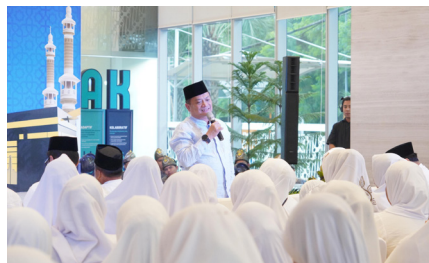
Pelepasan Ibadah Umrah Keluarga Besar PT PNM 2024, (7 Desember 2024).