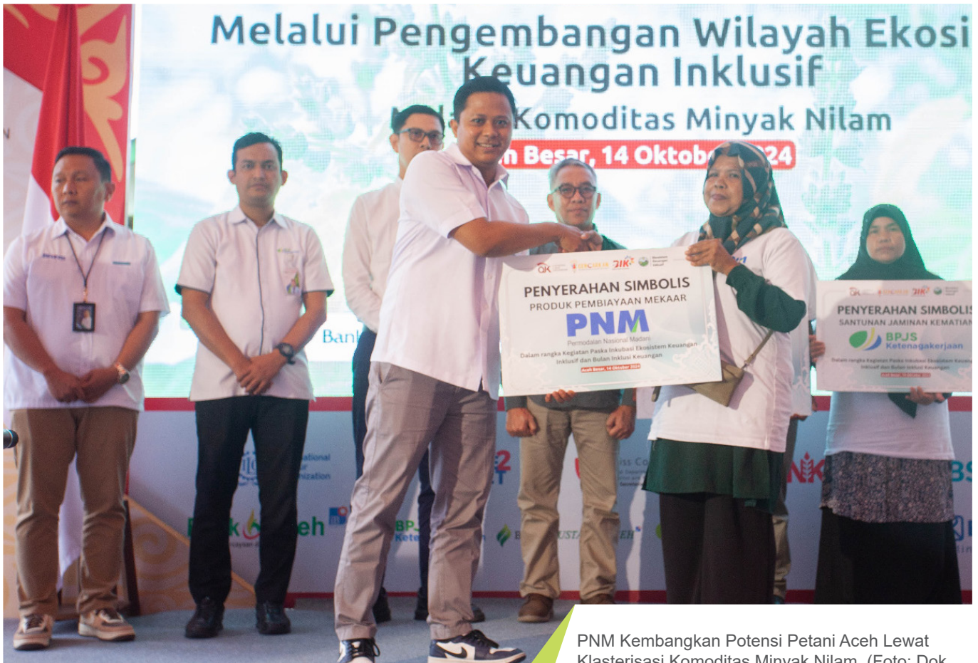
PNM Kembangkan Potensi Petani Aceh Lewat Klasterisasi Komoditas Minyak Nilam.