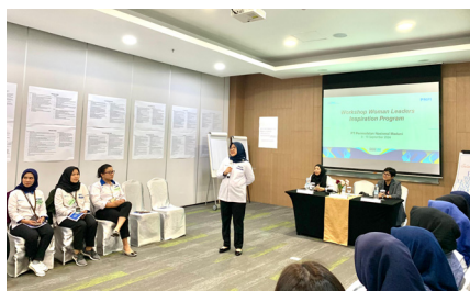
Workshop Woman Leaders Inspiration Program, (9 September 2024).