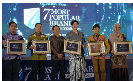
Jawa Pos 7 Most Popular Brand of the Year 2024, (3 September 2024).