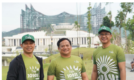
PNM turut berpartisipasi dalam kegiatan Nusantara Fun Run 2024, (6 Oktober 2024).