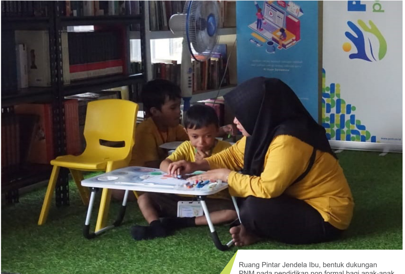
Ruang Pintar Jendela Ibu, bentuk dukungan PNM pada pendidikan non formal bagi anak-anak penyandang disabilitas di Bogor yang diberikan secara gratis.