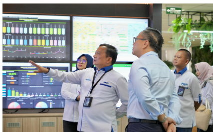
Kunjungan dan Arahan Wakil Menteri BUMN, (7 Oktober 2024).