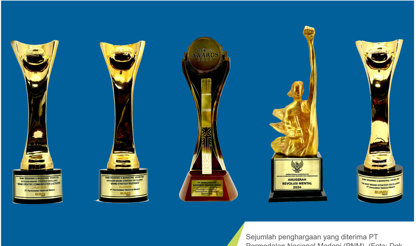
Sejumlah penghargaan yang diterima PT Permodalan Nasional Madani (PNM).

P T PERMODALAN NASIONAL MADANI (PNM) sebagai anak perusahaan Badan Usaha Milik Negara (BUMN) berkomitmen untuk meningkatkan kesejahteraan masyarakat, terus berinovasi dalam memberikan layanan permodalan dan pendampingan kepada para pelaku usaha, khususnya pelaku usaha yang bergerak di sektor mikro, kecil dan menengah (UMKM).