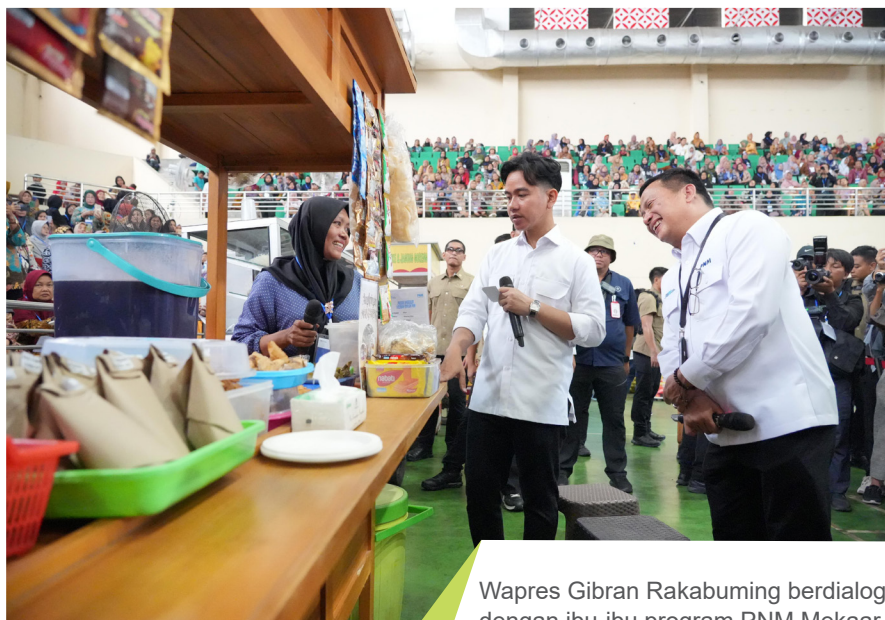
Wapres Gibran Rakabuming berdialog dengan ibu-ibu program PNM Mekaar.

Kunjungan Gibran memberikan arti tersendiri bagi para nasabah Mekaar. Mereka merasa istimewa