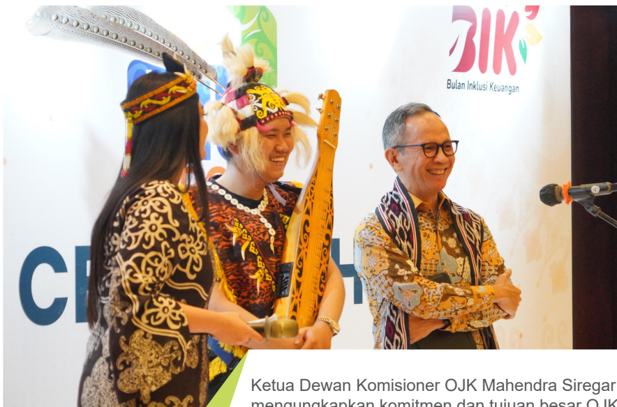
Ketua Dewan Komisiner OJK Mahendra Siregar mengungkapkan komitmen dan tujuan besar OJK untuk terus berfokus pada penguatan sektor jasa keuangan, terutama di wilayah 3T.

Rangkaian program literasi dan keuangan PNM menjadi salah satu langkah nyata dalam mendukung pengembangan inklusi keuangan. ●