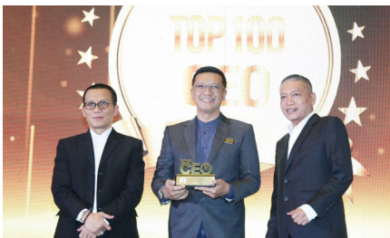
Infobank Top 100 and The 200 Future Leaders Forum 2024 , (29 November 2024).