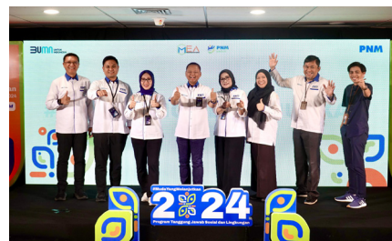
Seremonial Pembukaan Kompetisi Wirausaha Madani Entrepreneur Academy (MEA) 2024, (21 Oktober 2024).