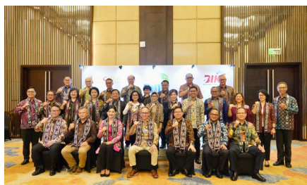
CEO Lunch Meeting & Kick Off Bulan Inklusi Keuangan (BIK) di FinExpo Tahun 2024, (5 Oktober 2024).