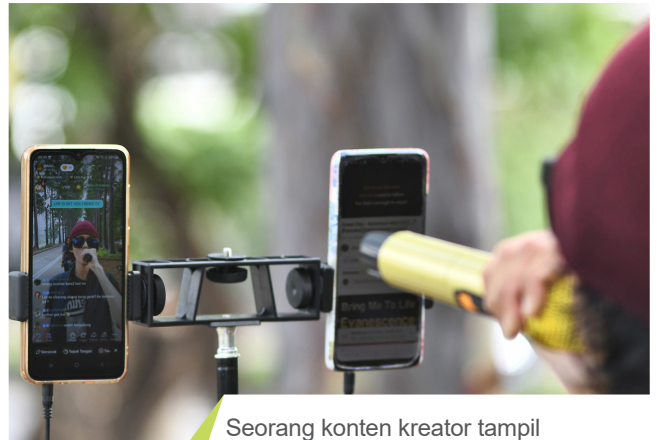
Seorang konten kreator tampil bernyanyi secara daring menggunakan smartphone .

storytelling untuk membuat video yang memikat audiens. Cobalah bereksperimen hingga menemukan ciri khas karya yang otentik.