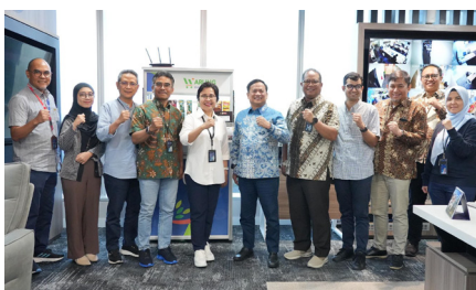
Pertemuan dengan Direktur Enterprise & Business Service Telkom Indonesia, (5 November 2024).