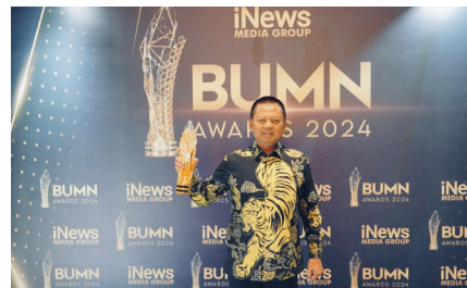
PNM Mendapatkan Award Kategori: Social, Culture, Ecological Transformation pada iNews BUMN Awards 2024 Outstanding Achievement In Public Empowerment , (5 Desember 2024).