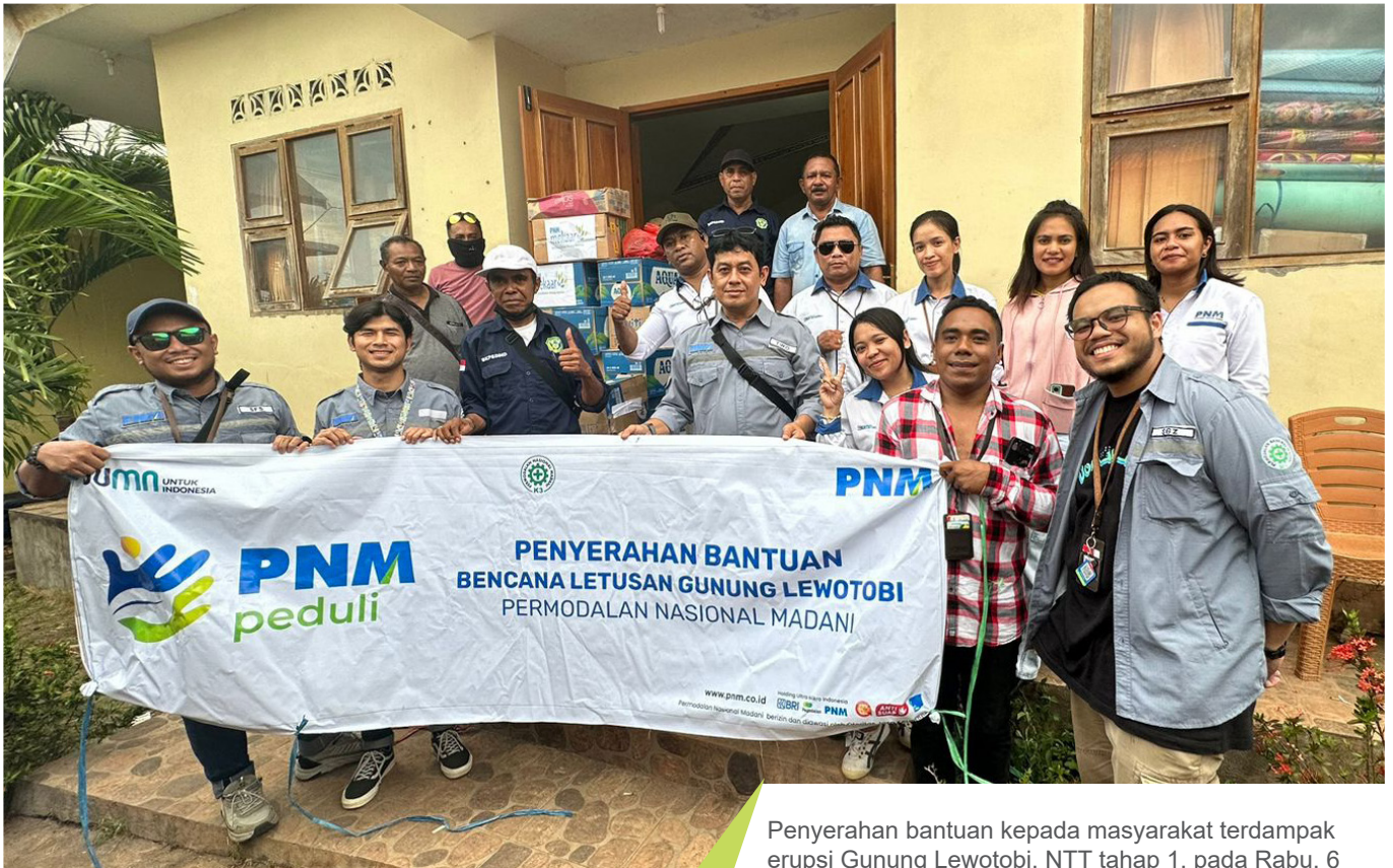
Penyerahan bantuan kepada masyarakat terdampak erupsi Gunung Lewotobi, NTT tahap 1, pada Rabu, 6 November 2024.