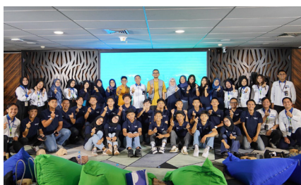
Kunjungan dan Kegiatan Peserta Madani Visual Parade Ke Menara PNM serta Peresmian Creatifolks, (11 November 2024).